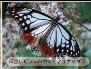
保全したフジバカマとアサギマダラ