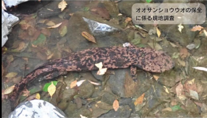
オオサンショウウオの保全に係る現地調査