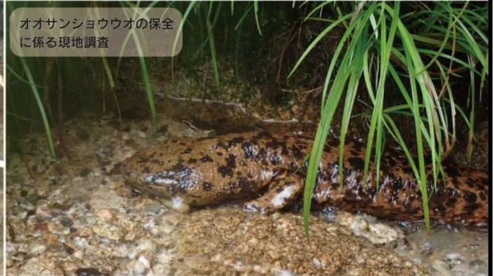
オオサンショウウオの保全に係る現地調査