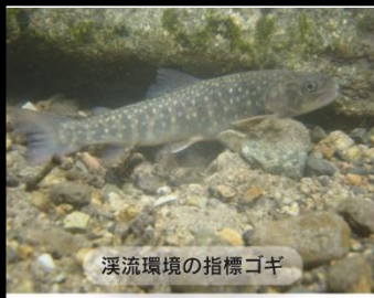
溪流環境の指標ゴギ