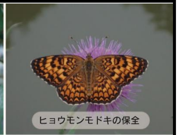
ヒヨウモンモドキの保全