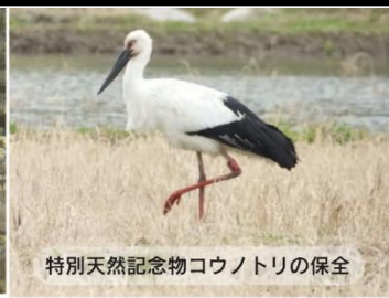
特別天然記念物コウノトリの保全